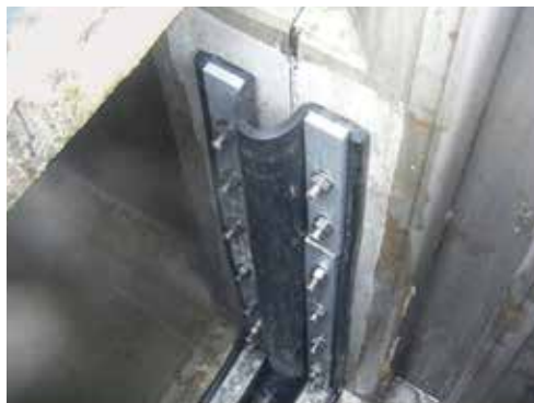
オメガ型止水ジョイント