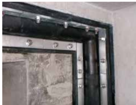
Lオメガ型止水ジョイント